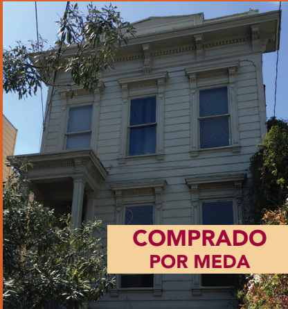
380 San Jose ante reparaciones

MEDA compra edificios y los hace mejores para vivir.