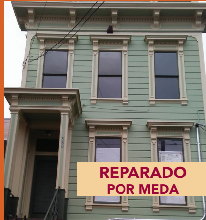
380 San Jose ante reparaciones